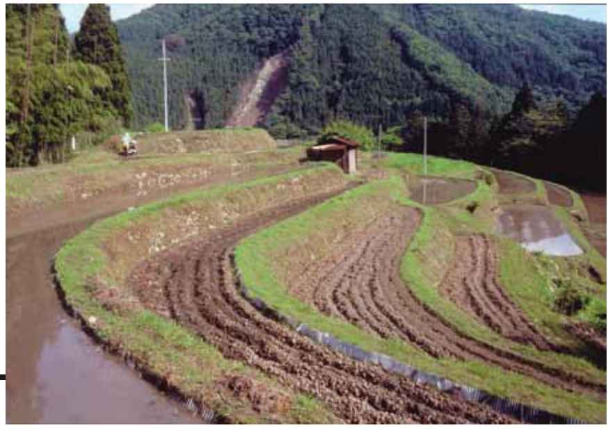
棚田の風景(三浦)