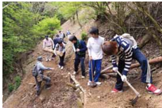
作業開始。地元の人たちと一緒に。